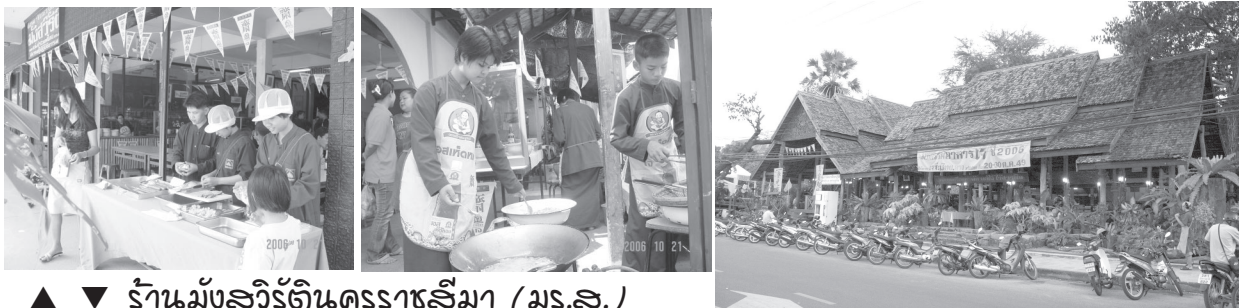
▲ ▼ ร้านมังสวิรัตินครราชสีมา (มร.ส.)

ชาวโศกได้ดำเนินการในการประสานงานเรื่องนี้มาตลอด สิ่งที่สำคัญพวกเราเป็นองค์กรที่มีการต่อต้านที่ชัดเจนและเหนียวแน่นเป็นรูปธรรม ตั้งแต่ไปรณรงค์เบียร์ข้างไมให้เข้าตลาดหลักทรัพย์ จนกระทั่งรต.พินิจ จารุสมบัติต้องมาเจรจาเพื่อที่จะเอา พรบ.นี้เข้าไปส่งคณะรัฐมนตรี แต่ท่านหมดความระไปเสียก่อน ถ้าเราไม่ได้ไปต่อต้านตรงนั้น ปานนี้จะไม่ใช้เฉพาะเบียร์ข้างที่เข้าตลาดหลักทรัพย์ฯ เยื่ออื่นๆ ก็จะตามเข้าไป เพราะการเข้าตลาดหลักทรัพย์จะทำให้อำนาจในการผลิตอำนาจในการเงิน รวมทั้งผู้ที่จะมาซื้อหุ้น คือผู้จะมาเป็นเจ้าของเกี่ยวข้องกับการผลิตเหล้าจะเพิ่มขึ้นอย่างมโหฬาร แต่ความแข็งแรงของเหล่าก็จะเพิ่มอย่างมาก เพราะฉะนั้นการที่มีรณรงค์จนประสบความสำเร็จ แม้เราจะเป็นส่วนหนึ่งเล็กๆ ที่ไปร่วมรณรงค์ก็เป็นความภาคภูมิใจของชาวโศก ที่ทำให้หยุดการขยายตัวของเบียร์ของเหล่าได้อย่างชัดเจน ถือว่าการมีส่วนร่วมเหนียวแน่นมีประสิทธิภาพจนเกิดผล.”