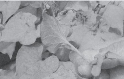
▶ ได้ใบมีสีม่วงบ่งบอกว่าแก่จัด

แต่มากที่สุด และกระจัดกระจายไปทั่วอาณาบริเวณของศูนย์เห็นจะหนีไม่พ้นพลูค่า หรือที่รู้จักของชาวล้านนาในนาม “ผักคาวตอง” ซึ่ง อ.สุริยา บอกว่าพลูค่า