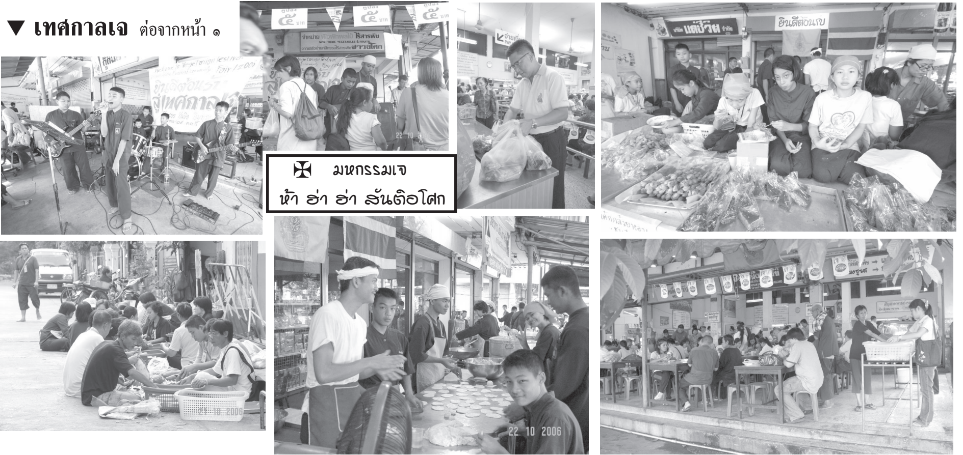
✠ มหกรรมเจ ห้า ฮ่า ฮ่า ฮันตือโศก

* พุทธสถานสันตือโศก ปีนี้ถือเป็นมิติใหม่ของชาวสันตือนากรที่ ได้จัด “มหกรรมเจ ห้า ฮ่า ฮ่า” ซึ่งก็คือ นอกจากการบริการขายอาหารเจที่ชมร.สาขาจตุจักร และร้านชมร.หน้าสันตือฯ ซึ่งมีอยู่อย่างเต็มที่แล้วนั้น ยังได้มีการตั้ง แผงบริการอยู่ที่บริเวณ หน้าร้านกัณฑ์ฟ้าและหน้าบจ.แต่ชีวิต เพื่อบริการอาหารเจแก่ประชาชนทั่วไปด้วยราคาเพียง ๕ บาทเท่านั้น การจัดมหกรรม ห้า ฮ่า ฮ่า ครั้งนี้ได้รับความร่วมมือ ร่วมแรงร่วมใจจากหลายฝ่าย เกิดเวทีแสดงดนตรีสดๆที่หน้าร้าน ซึ่งนักร้องและนักดนตรีก็คือพ่อครัวแม่ครัวหรือพ่อค้าแม่ค้าของเราเองทั้งเด็กเล็ก (นร.พุทธธรรมวินอาทิตย์) นักเรียนสามัญฯ แม่กระทั่งผู้ใหญ่ ผู้ปกครองนักเรียน และเจ้าหน้าที่ของร้านใกล้เคียง บรรยากาศเต็มไปด้วยความคึกคัก ตื่นเต้นทุกฝ่ายทั้งผู้ให้บริการและผู้รับบริการ สำหรับอาหารยอดฮิตเห็นจะไม่พ้น ซาลาเปา ผัดไทย และที่มาแรงแรงโขง (ให้บริการในวันหลังๆ เพราะกัณฑ์ใหญ่เพิ่งจัดเวลามาปรุงให้ได้) คือ ส้มตำและซุปรุ่นใหม่(แบบแซบอีหลีเด้อ) ผลที่ได้เกินการคาดหมายที่สุดของมหกรรม ห้า ฮ่า ฮ่า ก็คือ “ห้า” หมายถึงราคาขายแค่ ๕ บาทนั่นคือ การทำลายสถิติการขายอาหารเจที่ราคาถูกสุดถูกแทบหาไม่ได้ในเมืองไทยยุคนี้ “ห้า ฮ่า” หมายถึงเสียงหัวเราะอย่างมีความสุข ความพอใจ สนุกสนาน ตื่นเต้นสามัคคีและเป็นกันเองที่สุดของทั้งแม่ค้าและลูกค้า