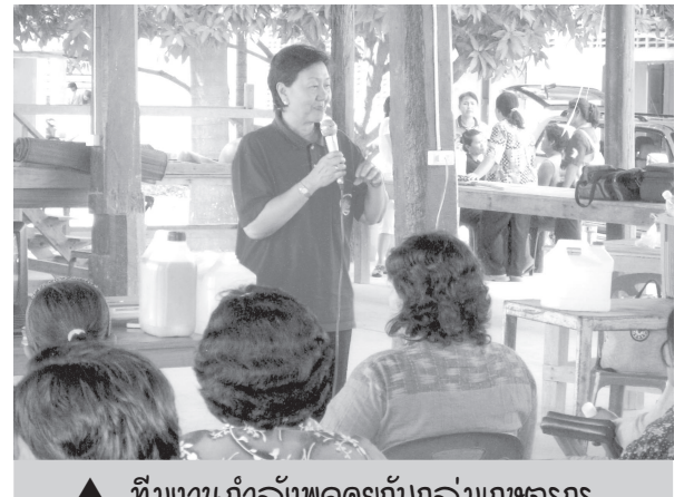
▲ ทีมงานกำลังพูดคุยกับกลุ่มเกษตรกร