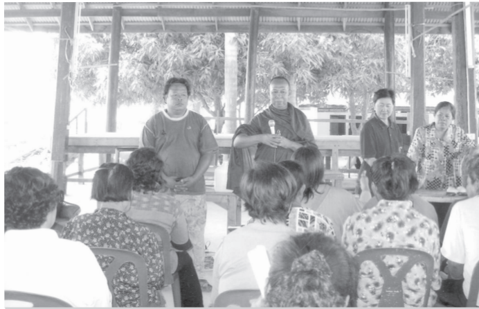
▲ ท่านเส็งงตีล และทีมงานเยี่ยมเยี่ยมงานเกษตรกรบ้านทัพทัน