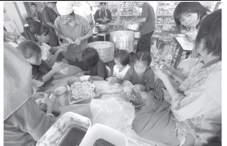
เทศกาลกินเจที่สวนหมักรวม ร.มธราชธานี มีผู้มาอุดหนุนมากมาย