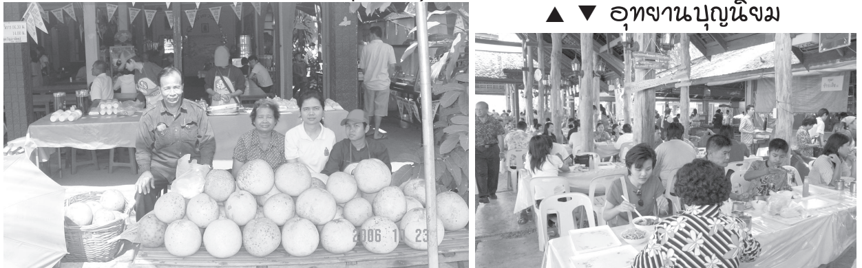
▲ ▼ อุทยานบุญนิยม