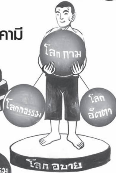
สกิทาคามี